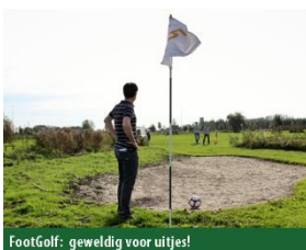
FootGolf: geweldig voor uitjes!

We gaan op de fiets naar Sportpark de Star, De Star 51, 2266 NA Leidschendam. Maximaal aantal deelnemers: 30.